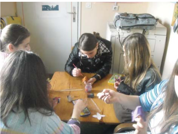
JU OŠ „Tojšići“, izrada cvijeća od školjke jaja