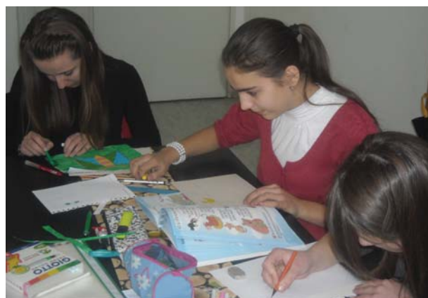
JU OŠ „Memići“ - Izrada didaktičkog materijala

Naše aktivnosti se nastavljaju u narednom periodu s iskrenom nadom da će naš rad biti još bolji, te da će postojanje ovakve jedne sekcije pomoći nastavnicima, edukatorima, ali i svima onima kojima je dijete u centru zbivanja, da što kreativnije osmisle svoj rad u nastavnim i vannastavnim procesima i pomognu razvoj intelektualnih i tjelesnih funkcija kod djeteta.