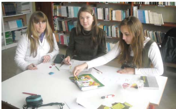
JU OŠ „Gornji Rainci“ - Izrada didaktičkog materijala

Članovi sekcije su u svojim evaluacijskim listovima takođe istakli i nedostatke kada je u pitanju rad sekcije, a to su: