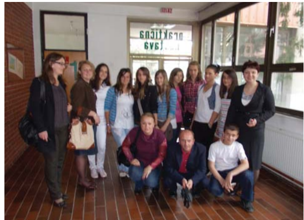
Obilazak Zavoda za odgoj i obrazovanje osoba sa smetnjama u psihičkom i tjelesnom razvoju, Tuzla