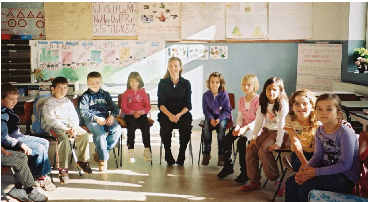
Radionica u JU OŠ "Tojšići" Učite i vi i pomozite drugima

„Mi smo se družili, radili, učili, pomagali i bili smo zadovoljni, jer smo učili kroz igru“.