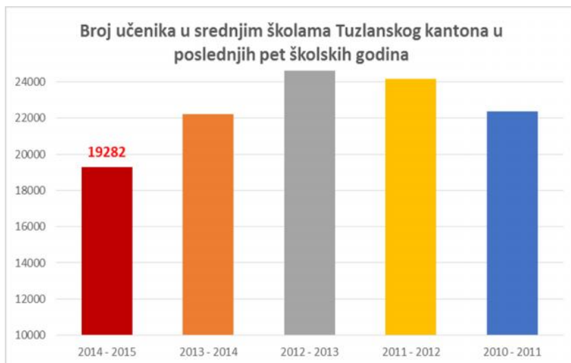
Slika broj 1. Broj upisanih učenika u srednjim školama na području Tuzlanskog kantona u zadnjih pet školskih godina

Podatke iz tablice možemo prikazati na slici te lako uočiti kako se u posljednje dvije školske godine znatno smanjuje broj učenika upisanih u srednje škole.